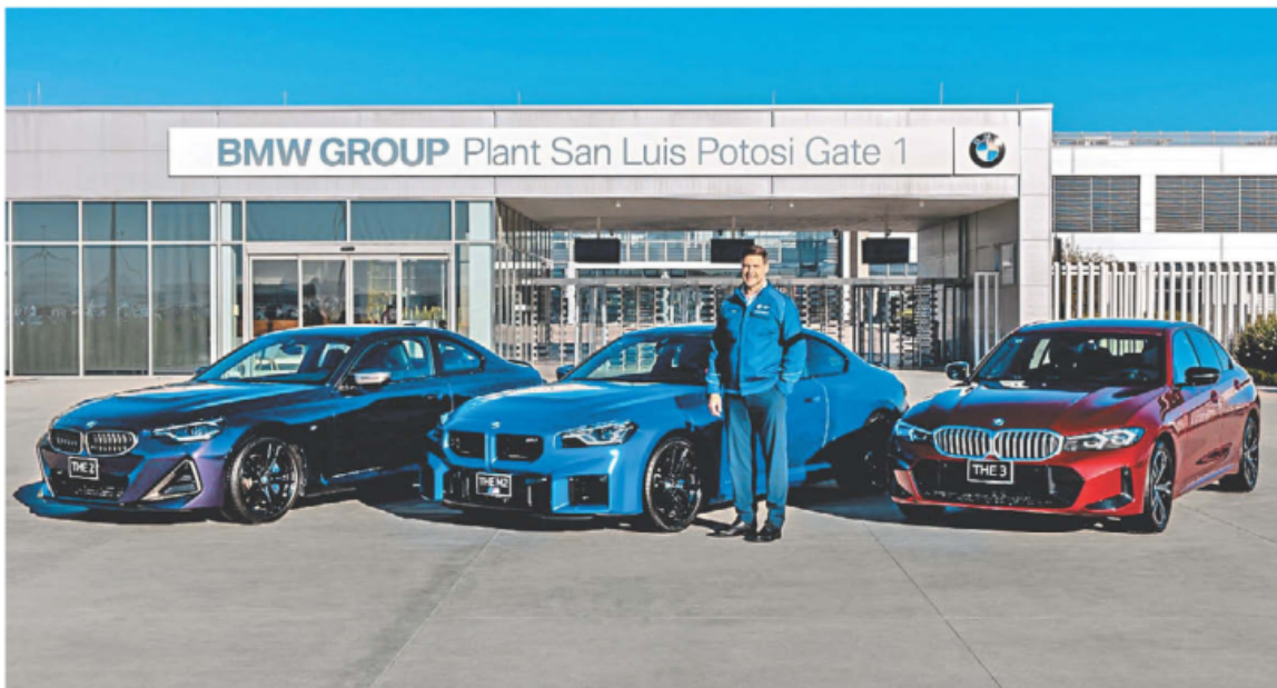
Klaus von Moltke sostuvo que no pueden mantener una relación si no se corrigen los aranceles.