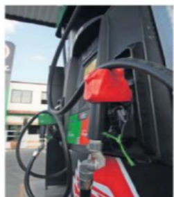
Los costos regulatorios y de logística empujan el precio del diesel, indican.

Previo a la reunión con Sheinbaum, el presidente de la Organi-