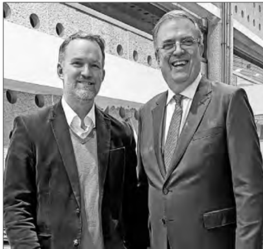
◀ El representante comercial de Estados Unidos, Jamieson Greer, y el secretario de Economía de México, Marcelo Ebrard, tras la llegada del funcionario del gobierno de Donald Trump, el domingo pasado.

Esta es la primera vez que Greer declara públicamente que México tendrá que convivir con al menos algún nivel de aranceles luego de las modificaciones del T-