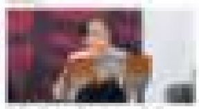
Edgardo Rivera No se debe contar de la vida pasada del leader