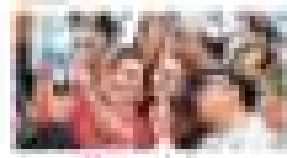
Reunión por la paz El gobierno debe respetar los derechos de los ciudadanos